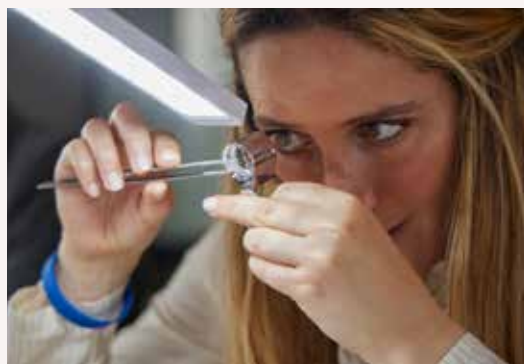
Cours Analyser un diamant