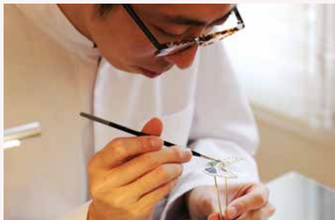
Cours Le bijou et les émaux grand feu

9h – 11h30 The Engagement Ring: A Love Story