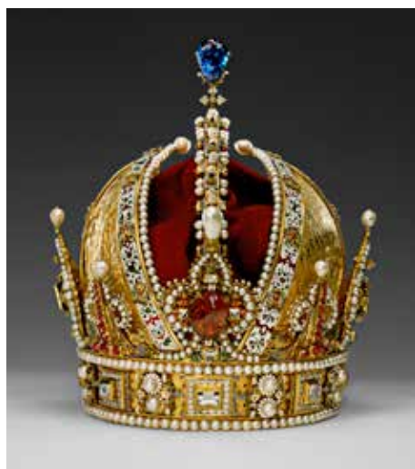
Jan Vermeyen Couronne de l'Empereur Rodolphe II, 1602, Schatzkammer, KHM, Vienne

— Conférence retransmise en direct depuis L'École des Arts Joailliers à Paris.