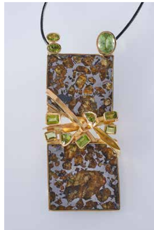
Jean Vendome collier Météor or jaune, pallasite, péridots, collection privée

Idee reçue: toutes les gemmes viennent de la terre