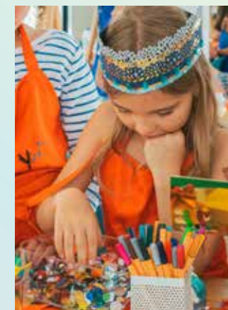
Cours Couronnes et épées

Découvrir le monde des pierres (pour les 12-16 ans) Mercredi 26 octobre Mercredi 9 novembre