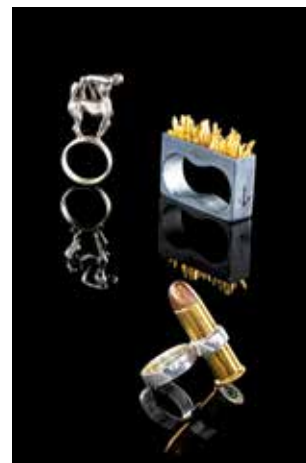
Groupe de bagues Collection Yves Gastou