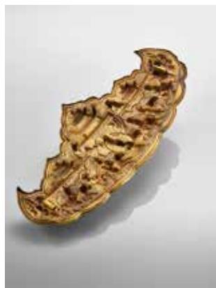
Ornement de coiffure avec motifs, Dynastie Ming, 1368-1644, Collection Mengdiexuan