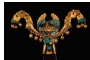
Ornement de nez représentant un homme avec une corde, or, turquoise, Culture mochica (100-800 apr. J.-C.)