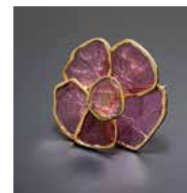
Jean Vendome Broche Rose 1974, or jaune, tourmalines Collection privée