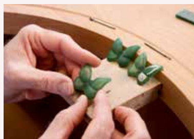
Cours Du projet en cire aux techniques de serti