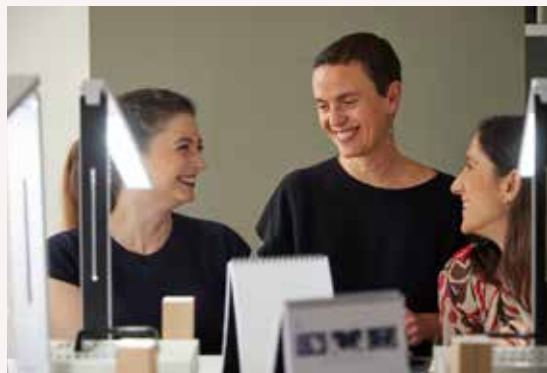
Cours Analyser un diamant

Atelier «À la découverte du métier de dessinateur de bijoux» pour les 12-16 ans