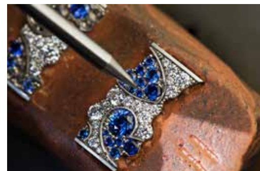
Sertissage à grains du bracelet Lady Jour des Fleurs - Lady Nuit des Papillons 2015

Idee reçue: Un bijou est l'œuvre d'un seul artiste