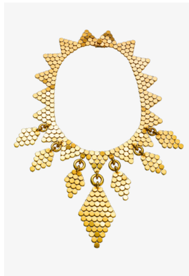
Van Cleef & Arpels Collier sequins 1971, or jaune Collection Van Cleef & Arpels