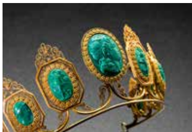
Diadème , 1806 Franz Kobek, Vienne Or, malachite Musée des Arts Décoratifs de Prague

9h – 12h: Visite privée, avant l'ouverture au public, du Musée des Arts Décoratifs de Prague et parcours au cœur de l'exposition «Le bijou et le corps» commenté par la conservatrice du musée