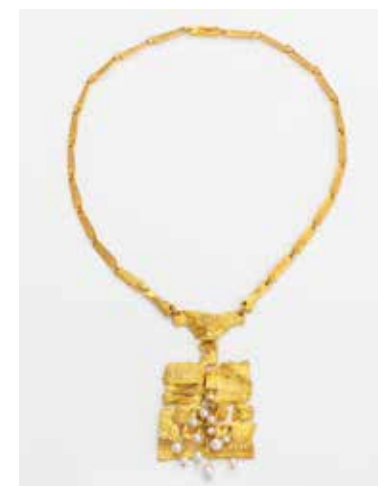
Björn Weckström Collier 1969, or jaune, perles, Collection particulière