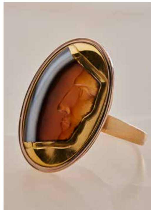
Rome? XVIII e siècle Profil de femme (Livia?) Intaille en sardonyx sur une bague en or Collection Guy Ladrière

non d'un fragment original remonté sur une bague récente. Au XVIII e siècle, le goût des camées et des intailles antiques conduit à produire de nombreuses copies et imitations; c'est aussi l'esthétique du fragment romantique qui apparaît, portée par les fouilles d'Herculanum et de Pompéi au milieu du siècle. Avec elle, se propage lentement l'idée que nulle civilisation n'est impérissable. Le goût des ruines et de la pièce brisée porte à une méditation sur le temps qui passe. Cette poésie-là, elle, est durable.