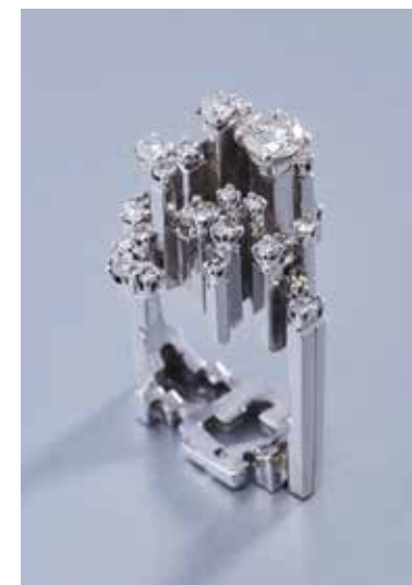
Jean Vendome Bague 5 th Avenue 1966, or blanc et diamants