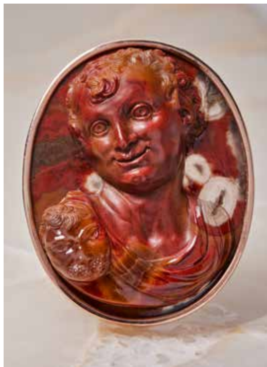
Europe du Nord? XVII e siècle Faune Camée en jaspe sur un pendentif en or Collection Guy Ladrière

excès qu'il engendre, il est également un dieu de la fécondité. Ce camée traduit parfaitement le goût pour l'Antique du XVI e au XVII e siècle.