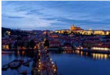
Vue du pont Charles et du Château de Prague depuis la Tour du pont Charles côté Vieille Ville

10h – 12h30: Immersion dans l'univers d'un atelier et centre de taille de grenats: échanges avec les artisans qui vous feront découvrir toutes les étapes de la création d'une pièce, de la taille des pierres au bijou final