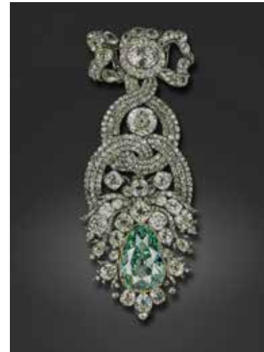
Diamant Vert de Dresde

9h – 12h: Fondée en 1723, la Voûte Verte est un «musée trésor» unique en Europe, par la richesse et la grandeur de ses collections.