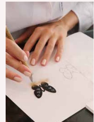
Cours Du bijou français à la laque japonaise